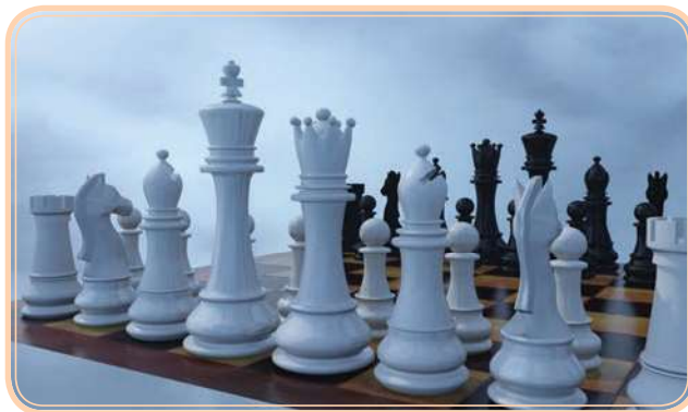
Figura 11.1 – Estratégia