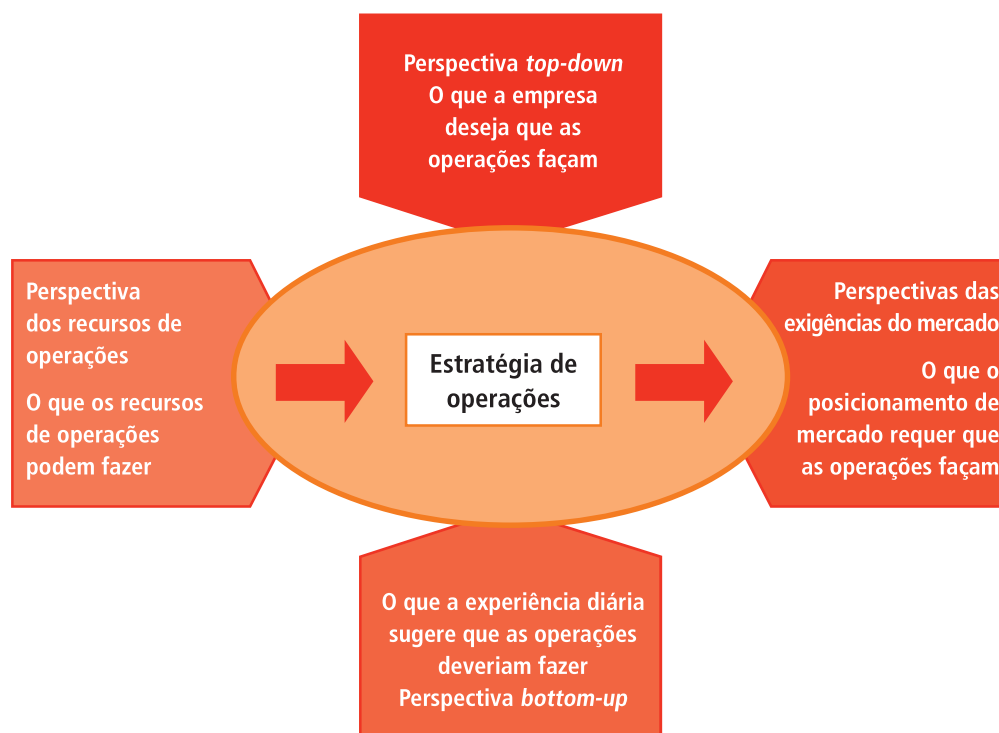
Figura 11.2 – Perspectivas da estratégia de produção

Nenhuma dessas quatro perspectivas sozinhas dá-nos uma visão geral do que seja a estratégia de produção. Em conjunto, no entanto, elas fornecem uma ideia das pressões em jogo para formar o conteúdo da estratégia da produção, conforme representado na figura 11.2 .